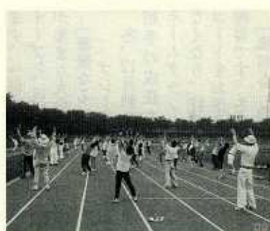
ラジオ体操祭 (秋留台公園)