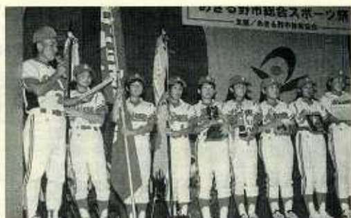
活躍目ざましいオールあさる野女子チーム