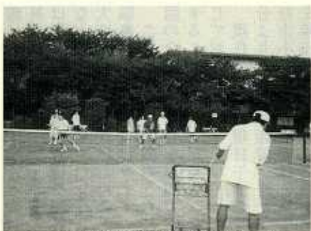
テニス連盟の練習(総合グラウンド)