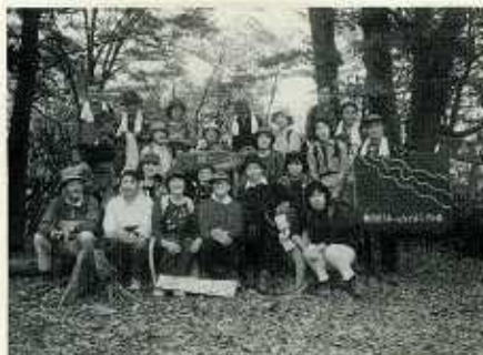
スキーとハイキングの会 (高水山頂)

あさる野市スキーとハイキングの会は、昭和44年2月に野沢温泉スキー場で行われた教育委員会主催のスキー教室の際「我が秋多町にもスキークラブを結成しよう」との声が参加者の中