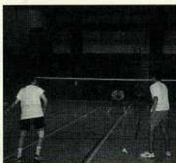
バドミントン連盟

出来たシャトル(羽根)をお互いに打ち合う優雅なスポーツと思われがちですが、世界の一流選手が打つシャトルのスピードは初速350kmとも言われ、そのシャトルを81・74mのコート内で拾い打ち合う、スピード感もあり、ゲームでのテクニク