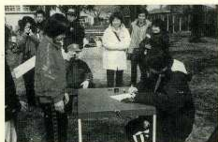
増淵選手(オリンピック日本代表)のサイン会となったピッチング講習会

一つに位置付けられます。最近の主要事業は連盟主催大会が年間12大会(小学生大会からシニア大会まで約5600名参加)、その他主管する大会は2大会です。又上位大会(都ソフトボール協会・日本ソフトボール協会主催大会など)は年間10チーム以上が出場して活躍しています。